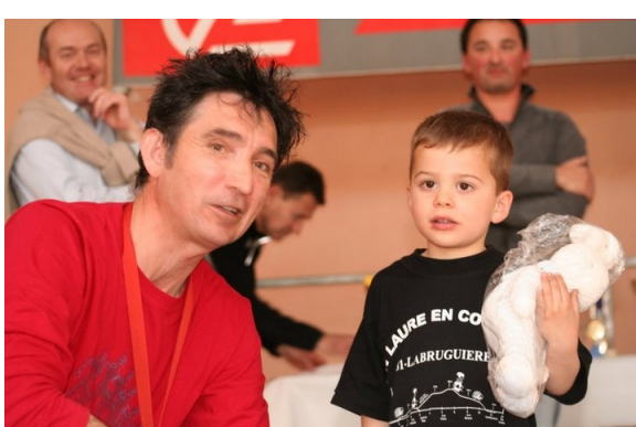
Une peluche pour le plus jeune coureur