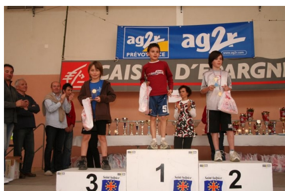
Podium 800 m