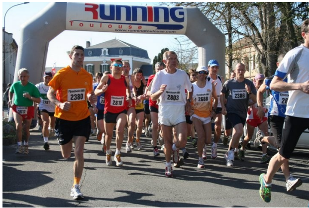
Départ sur l'avenue Vialas