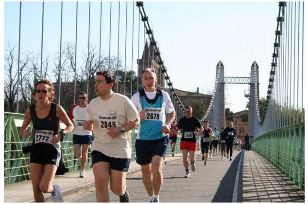
Traversée du Pont Suspendu vers St Waast