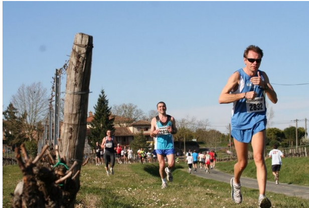
Ravitaillement et demi-tour au Domaine de la Valière à St Waast