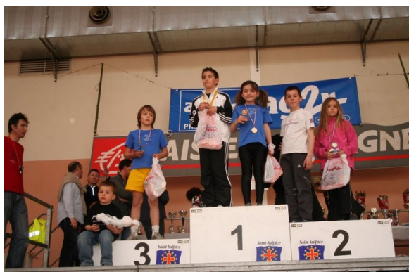
Podium 400 m

Grâce à vous tous, cette 3è édition des Pieds en Fête a été un véritable succès ! Merci et à l'an prochain. Pour tous les résultats et les photos, rdv sur www.clochepieds.info »