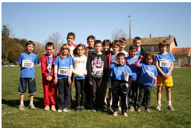
Nos Graines de Cloche Pieds