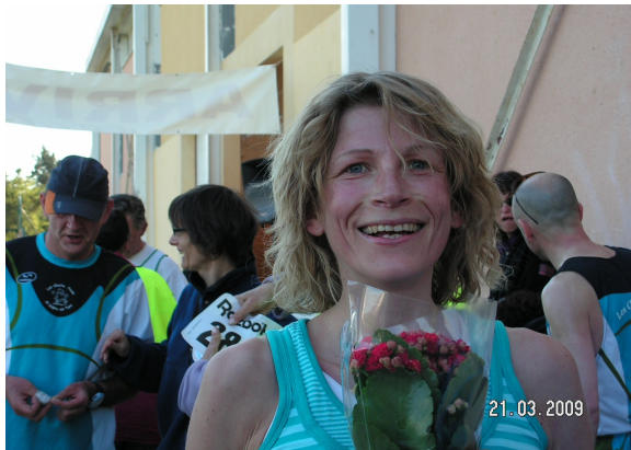
Une plante pour toutes les féminines