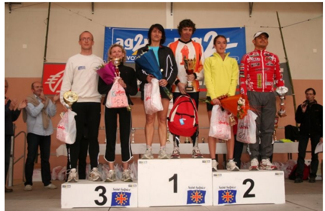
Les vainqueurs femmes & hommes