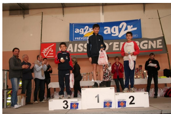
Podium 1200 m